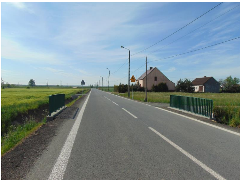
zdj. przebudowana część DP 3534S od strony Budzisk

W II półroczu 2020 roku rozpoczęto realizację kolejnych zadań, którymi są: