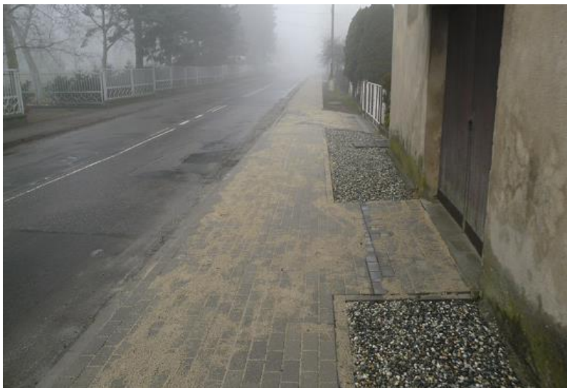
zdj. fragment zmodernizowanego odcinka DP 3543S ul. Brzezkiej w Pogrzebieniu