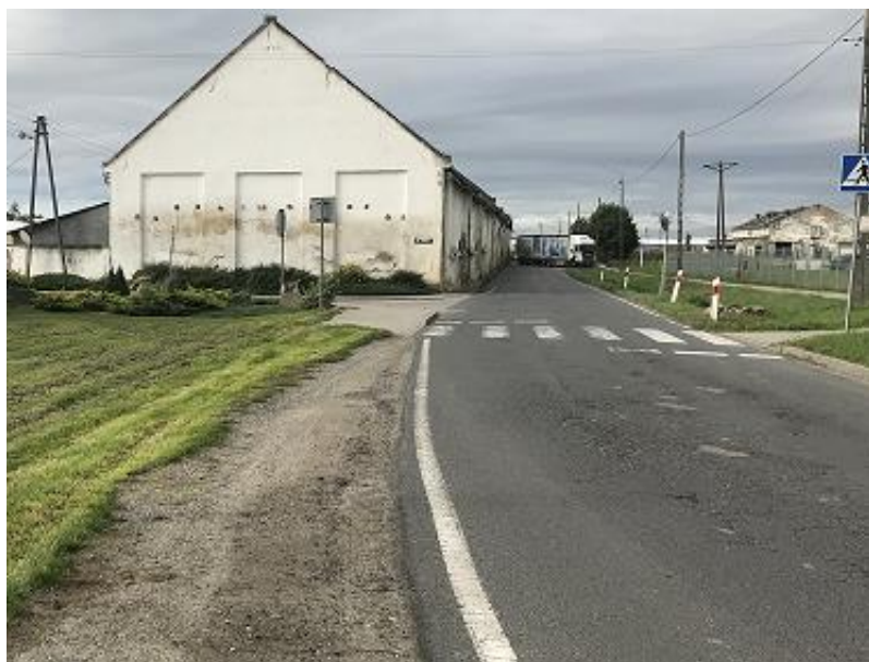
zdj. fragment DP 3504S ul. Spółdzielczej w Kornicach etap II (stan istniejący)