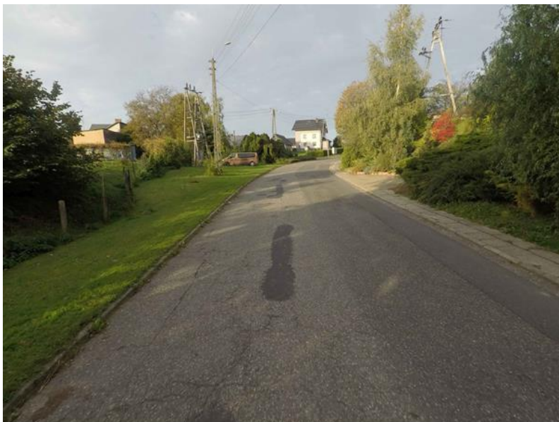
zdj. fragment DP 3529S ul. Dr Józefa Rostka w Borucinie (stan istniejący).