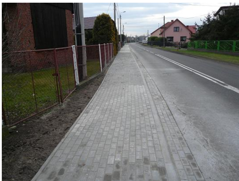
zdj. fragment zmodernizowanego odcinka DP 3509S ul. Gliwickiej w Siedliskach

Zadanie zostało zakończone, protokół odbioru końcowego spisano w dniu 16.12.2020 r.