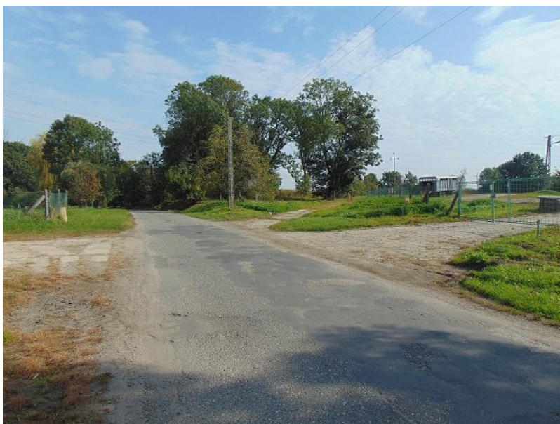
zdz. fragment DP 3517S ul. Dworcowej w Tworkowie (stan istniejący)