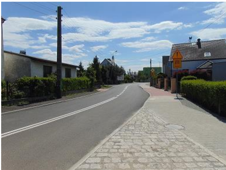
zdj. część przebudowanej DP 3509S ul. Raciborskiej w Turzu