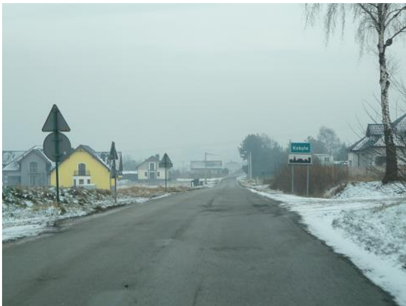
zdj. fragment DP 3540S ul. Głównej w Kobyli (stan istniejący)

Na przełomie I i II kwartału planuje się przeprowadzić postępowanie przetargowe w celu wyłonienia Wykonawcy. Planowany termin zakończenia zadania to październik 2021 r.