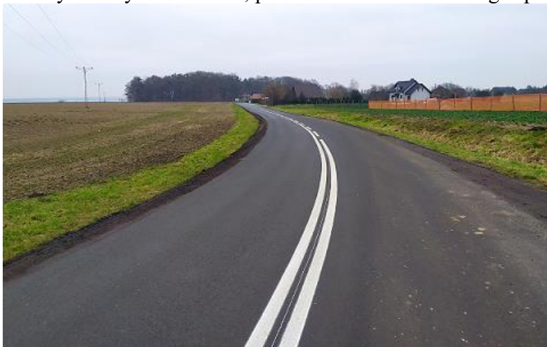
zdj. fragment wyremontowanej drogi wojewódzkiej DW 421

Roboty zostały zakończone, protokół odbioru końcowego spisano w dniu 18.12.2020 r.