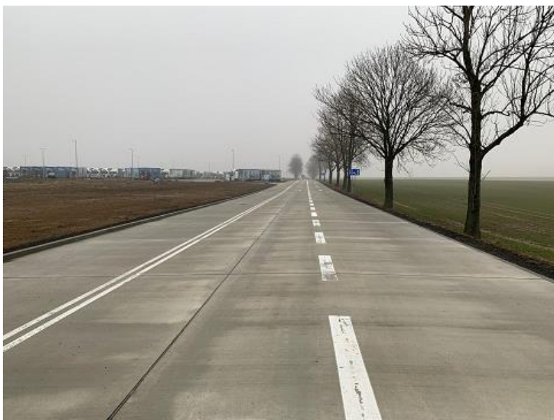
zdj. przebudowana część DP 3504S ul. Spółdzielczej w Kornicach - etap I

Zakres obejmuje: jezdnię (w tym wykonanie trzeciego pasa ruchu do relacji skrajnych) o nawierzchni betonowej, zjazdy, pobocza, przebudowę urządzeń odwadniających oraz odmulenie rowów. Prace te zostały zakończone na początku lutego 2021 roku.