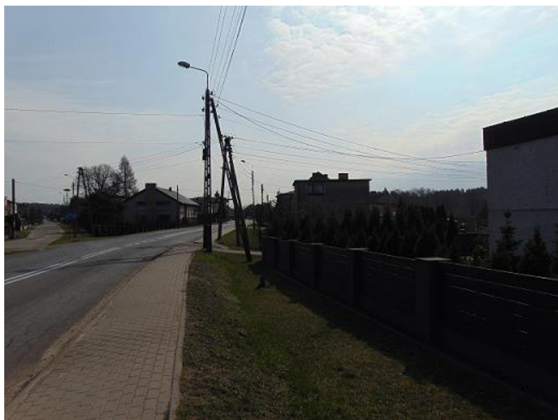
zdj. fragment DP 3536S ul. Ofiar Oświęcimskich w Górkach Śląskich (stan istniejący)