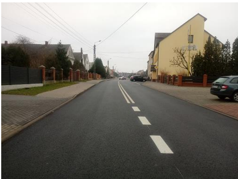
zdz. część wyremontowanej DP 3516S ul. Głównej w Tworkowie

Z kolei w ramach przebudowy ul. Dworcowej zostanie wymieniona cała konstrukcja jezdni na odcinku o długości 560 mb od ul. Zamkowej do skrzyżowania z drogą gminną i nawierzchnia bitumiczna na dalszym odcinku o długości 590 mb do terenu przejazdu kolejowego.