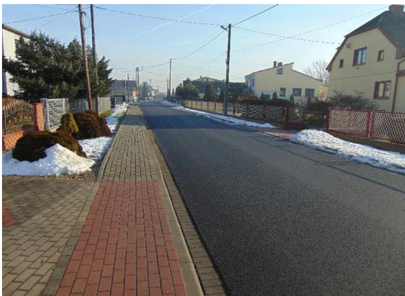
zdj. fragment przebudowanej DP 3532S ul. Wiejskiej w Rudyszwałdzie