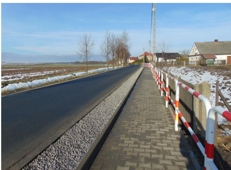
zdj. fragment przebudowanej DP 3532S ul. Rakowiec w Rudyszwałdzie