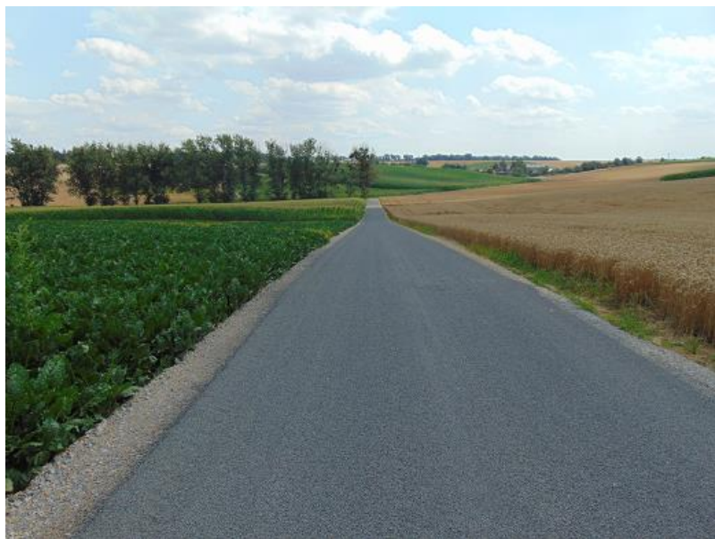
zdj. fragment utwardzonej drogi D-5 w Amandowie

Roboty zakończono w grudniu, a wszystkie protokoły odbioru końcowego spisano do dnia 16.12.2020 r.