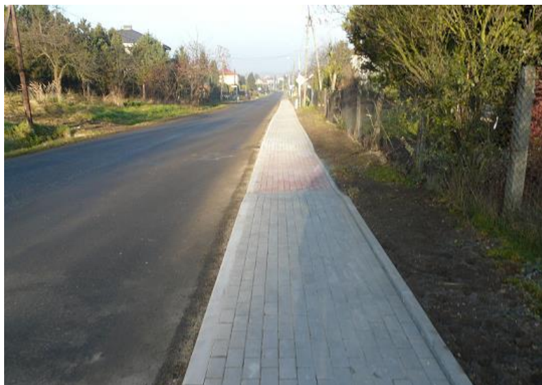
zdj. fragment zmodernizowanego odcinka DP 3534S ul. Pogrzebieńskiej w Raciborzu

Zadanie zostało zakończone, protokół odbioru końcowego spisano w dniu 07.12.2020 r.