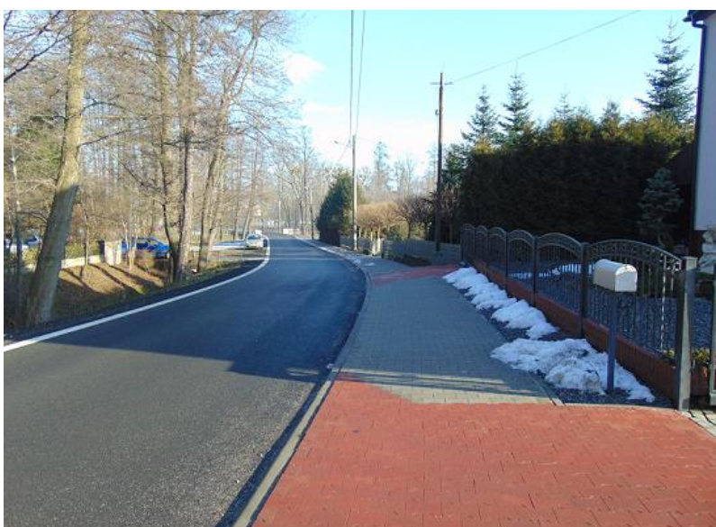
zdj. fragment przebudowanej DP 3532S ul. Głównej w Rudyszwałdzie