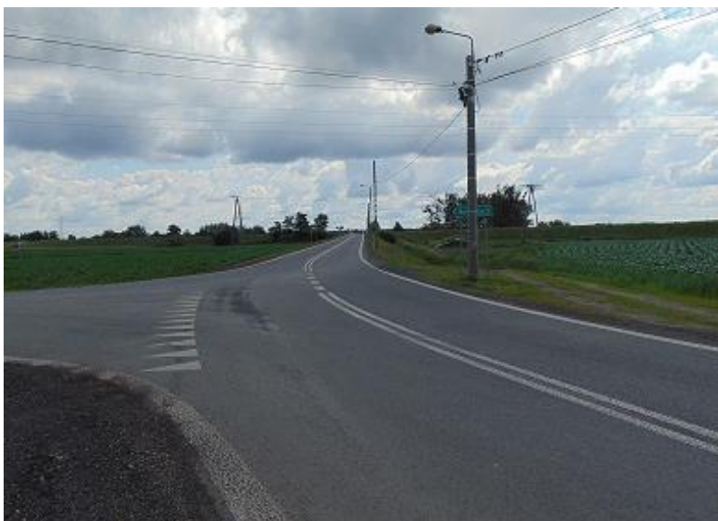
zdj. przebudowane skrzyżowanie DP 3509S i DP 3534S w Turzu